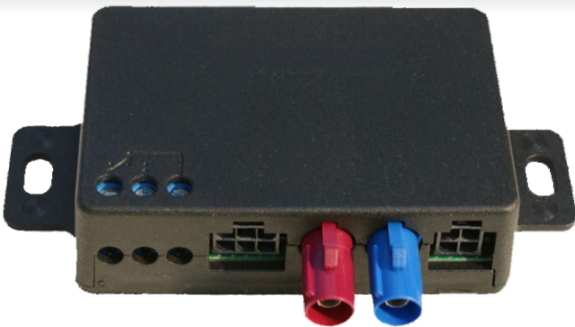
(89 x 55 x 18 mm - 43 g)